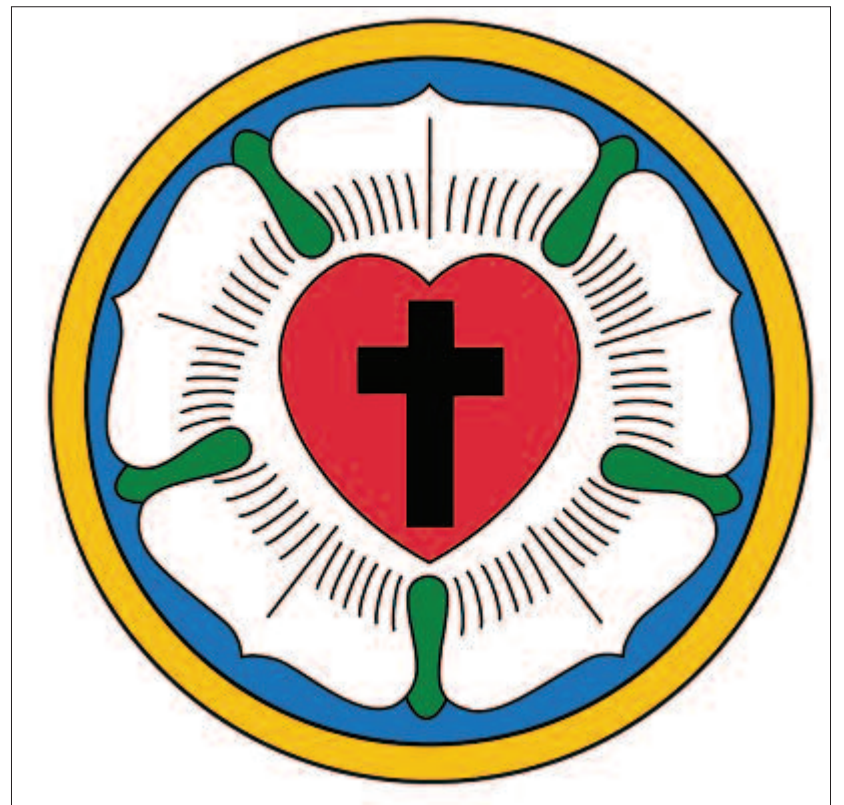
Ez az evangélikus egyház jelképe, amelyről a reformátor így vall: középen ott van a kereszt, ami a megfeszített Krisztusra emlékeztet. Ez a kereszt egy piros szívből található, ami fehér rózsaszín szirmain nyugszik. S mindezt körülveszi egy aranymező, ami az emberi öröme és boldogságra emlékeztet.

Egy ötödfél évszázados egyház múltját és súlyát, szellemi és lelki értékét, kulturális és művelődési fontosságát nemcsak a templomok és az ezekben végzett vallásos tevékenységek mutatják, hanem közvetve és közvetlenül beleépül hatása a helység életébe. Így gazdagította a város szellemi és tudományos életét a több mint 450 éves református kollégium messze földön híres tanárával és itt végzett tanulóival, majd az egykori leányiskolával.