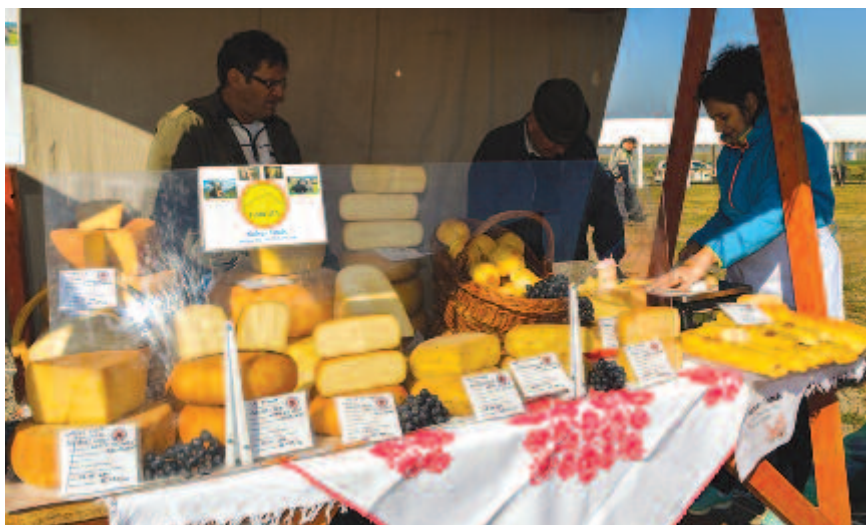
Sajtmustra a csíkszentsimoni termékiállításon

A Csíkszéki Gazdanapok Csíkszentsimonban, a Csaba testvér alapítványa által gondozott Szent László Gyermekvédelmi Központban zárult, ahol a különböző helyi termékek bemutatója mellett versenyképes termékekkel vonultak fel a kézműves sajtőkészítők a csíkszentsimoni Csengő tájszövetkezet által szervezett sajtmustrán, volt lófajta- és szarvasmarha-bemutató, kisállat-kiállítás, kézművesvásár, szekérhajtó és rönkhúzó verseny, valamint kulturális program is.