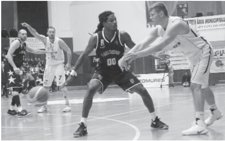
Igazán kiegyensúlyozott csak az első felében volt a találkozó, szünet után már alaposan megváltoztak a dolgok.

A Maros KK szakvezetői stábjának nagy nehézséget okozott előkészíteni a mérkőzést, hiszen a klub anyagi nehézségei miatt több játékos nem edzett az utóbbi napokban, és végül csak annak köszönhetően tudták kiállítani szinte legjobb összetételében az együtttest, hogy az utolsó száz méteren kifizettek egyhavi juttatást az előző évből elmaradt fizetésekből azoknak a játékosoknak (Mohammed, Martinic, Lázár, Polyák), akik tagjai voltak az elmúlt bajnokságban