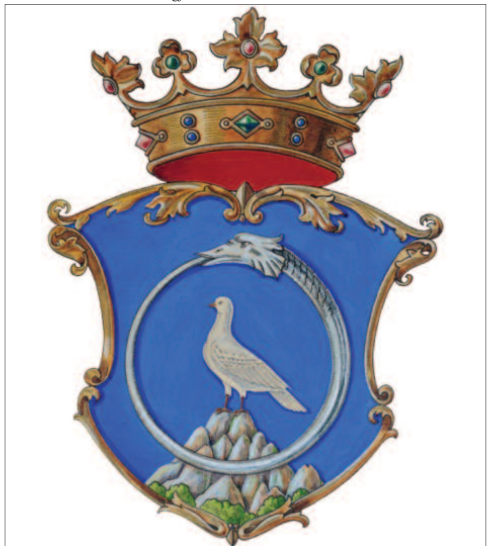
A Magyar Unitárius Egyház címerének alappondolata Jézus küldőparancsából való: „legyetek okosak, mint a kígyók, és szelídek, mint a galambok” (Mt 10,16).

Sorozatunkban igyekszünk ezeket a protestáns gyülekezeteket és templomaikat részletesebben is bemutatni, s akkor majd neves vagy kevésbé ismert nevek kerülnek elő a feledés homályából, olyanok, akik hozzájárultak a város lelki, szellemi, kulturális életének gazdagításához. Példaként csak a kisebbségi létben eltől-